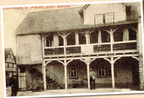
1900: Gasthaus zum Adler Inhaber: Johann Seipel