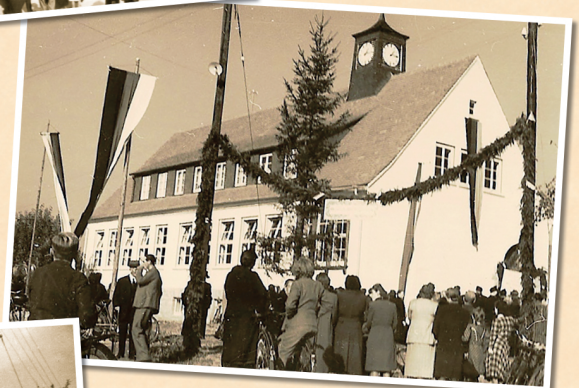
1951: Einweihung Schule