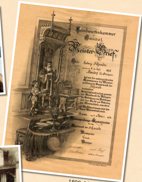
1898: Meisterbrief im Schmiede-Handwerk