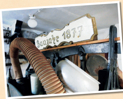
1877: Wasserspritze (im Original noch vorhanden!)