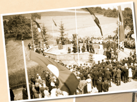
1936: Einweihung Ehrenmal