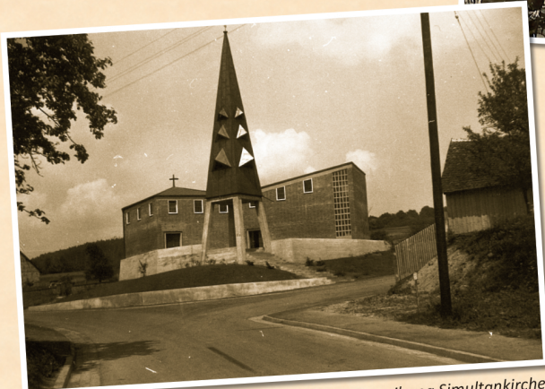
1962: Einweihung Simultankirche