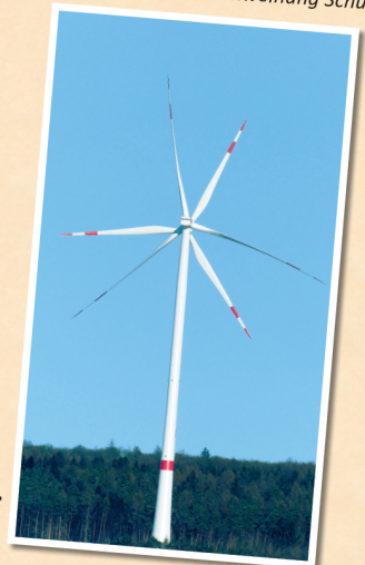
2014: Inbetriebnahme Windkraftanlagen