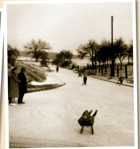
1964: Marina Zimmer auf Schlittenbahn Kleine Hohle, heute - Bad Sodener Straße