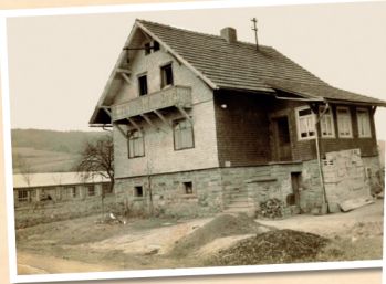
1954: Am Rosengarten 9