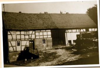
1955: Anwesen Schroeder, Aufenauer Str. 19