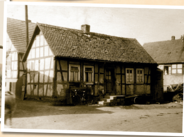
1954: Haus Rehberger, Am Rosengarten