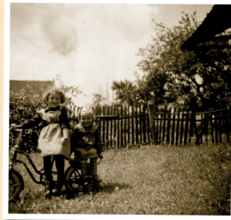
1956: Waltraud Kolb und Irmgard Werth